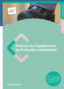
Portons nos EPI

Vous pouvez également consulter sur www.apst41.fr nos autres feuillets prévention.