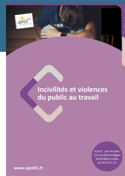
Incivilités et violences

Créée le 7 octobre 1947, l'A.P.S.T. Loir-et-Cher est constituée sous la forme d'association (Loi 1901) à but non lucratif.