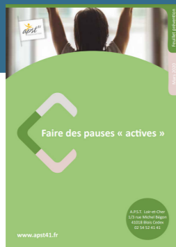
Faire des pauses « actives »